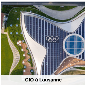
CIO à Lausanne