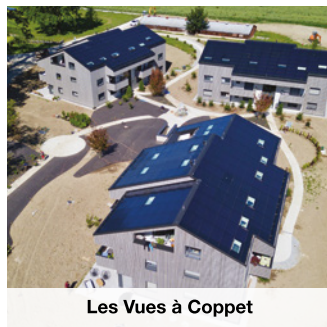
Les Vues à Coppet