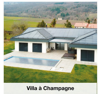
Villa à Champagne